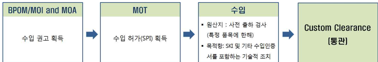
<그림 3> 인도네시아 수입절차 흐름도

* BPOM: 의약식품관리청/ MOI: 산업자원부/ MOA: 농업부/ MOT: 무역부/ SKI: BPOM으로부터 입국 허가